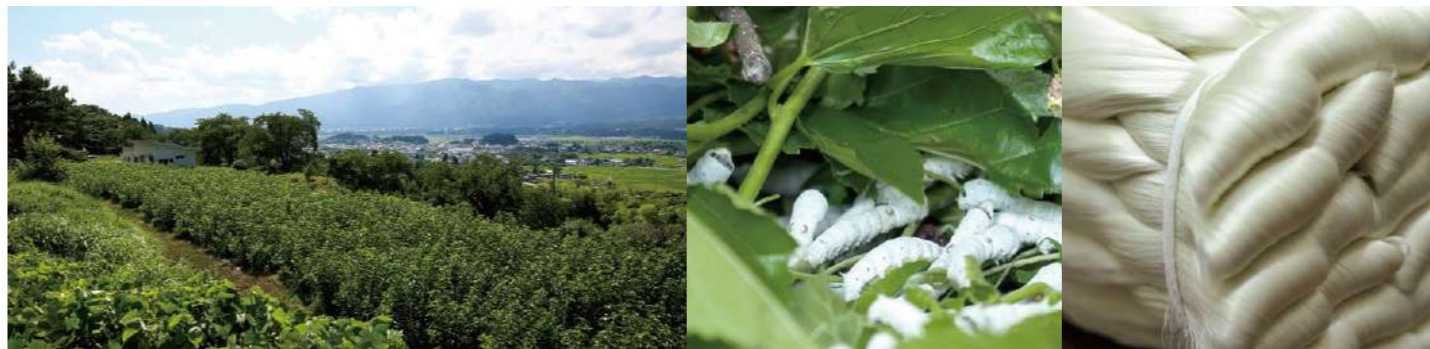
左から、白鷹に開墾した桑畑。桑の葉を食べるカイコ。カイコの糸から生産された絹糸。これが純山形産の着物になる

編集部では、後援会員企業と卒業生・在学生の協働した事例を積極的に紹介してまいります。記事として取り上げてほしい情報がありましたら、ぜひご連絡ください。