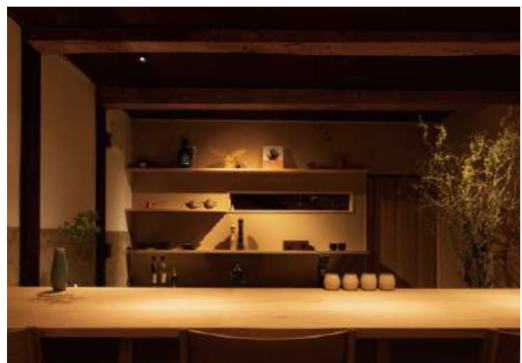
上：今春、山形県白鷹町に開業した着物リトリートホテル「NIPPONIA 白鷹 源内邸」。この施設の開業には本学関係者も多数関わった。広大な敷地に点在する古民家は、このホテルのコンセプトにふさわしいたずまいを見せている／下：シンプルなモダンなダイニング「纏（まとい）」は、味噌蔵をリノベーションして作られた。これからさらに歴史を積み重ねていくための心地よい「余白」が感じられる