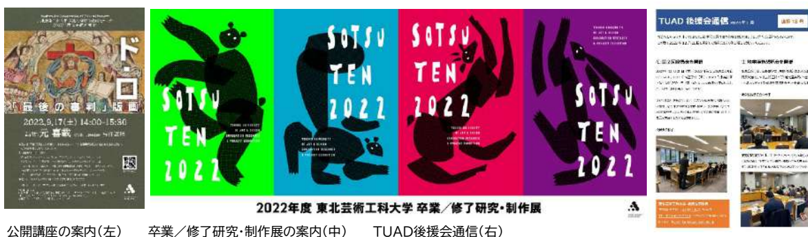
公開講座の案内(左) 卒業/修了研究・制作展の案内(中) TUAD後援会通信(右)