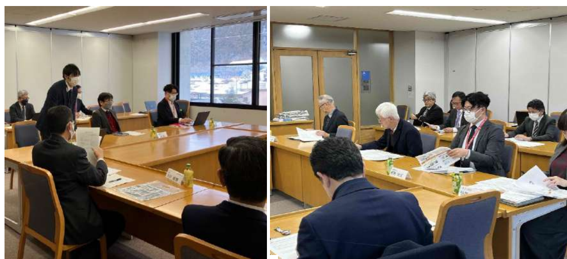
地学連携懇話会の様子:第1回(左)/第2回(右)