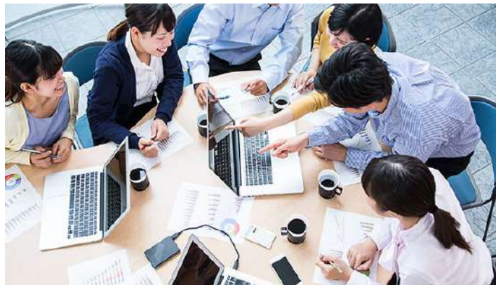
アンケート調査依頼状(左) インターンシップイメージ(右)