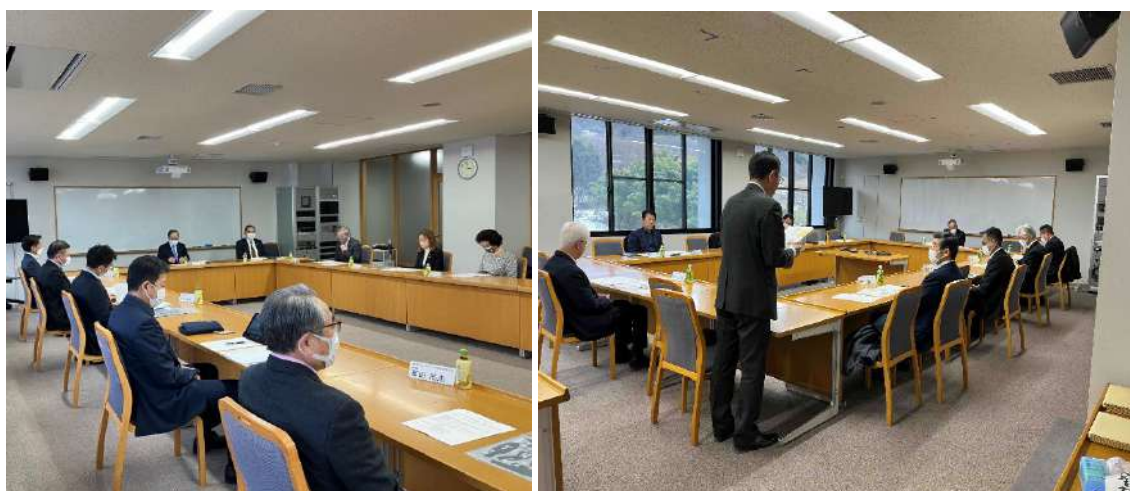
役員会の様子:第1回(左)/第2回(右)